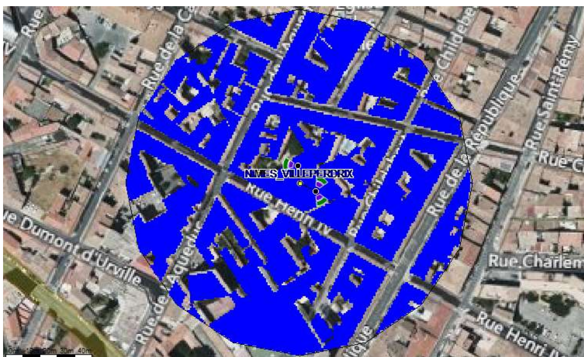
Fond de carte (photo aérienne), source : bing. Logiciel de simulation Cellergy, éditeur Orange Labs

À 1,5 m du sol, le niveau maximal simulé en intérieur pour les antennes à faisceaux orientables est compris entre 0 et 1 V/m.