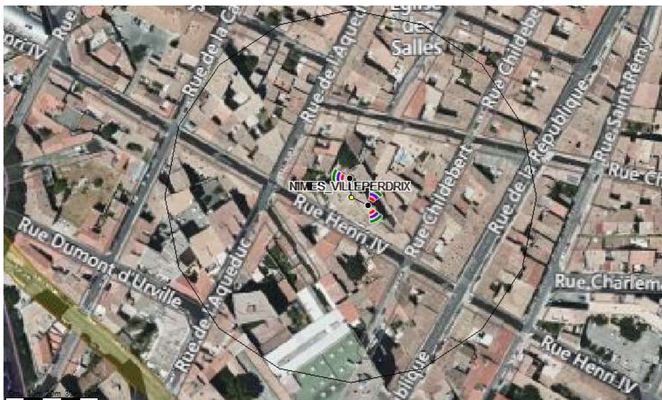
Fond de carte (photo aérienne), source : bing.