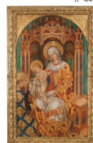
Michele Giovanni, dit Giambono Le Mariage mystique de Sainte Catherine d'Alexandrie vers 1430 Tempera sur bois. IP 441

Celui de L. di Credi est plus tardif puisqu'il a été réalisé au début du XVI ème siècle. On remarque alors sur ce tondo l'influence du célèbre Léonard de Vinci avec un léger sfumato qui adoucit les contours des visages. En arrière plan, l'artiste a développé une belle perspective aérienne. Des scènes secondaires sont ajoutées : à gauche on peut voir saint François d'Assise recevant les stigmates et à droite saint Jean-Baptiste enfant.