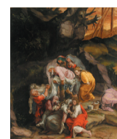
Lelio Orsi Mise au tombeau, après 1578 Huile sur toile IP 2633

L'équilibre artistique de la haute Renaissance est rompu, le Jugement dernier dévoilé par Michel-Ange en 1541 est emblématique de cette période de doute et de réaction. Durant quelques années, Florence réunit trois des plus grandes personnalités de la Renaissance : Léonard de Vinci (1501 à 1506-1508), Michel-Ange (1501-1506) et Raphaël (1504-1508). Leur présence fait naître une maniera moderna qui sera la référence maniériste.