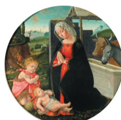
Suiveur de Filippo Lippi La Vierge et Saint Jean-Baptiste adorant l'Enfant Jésus Seconde moitié du XV ème siècle Huile sur bois IP 435