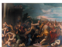
Ippolito Scarsella Le Massacre des Innocents, vers 1600/10 Huile sur toile IP 483

Les écoles de peinture sont très importantes en Italie, chacune travaille sur des concepts et des idées différents. « La poesia vénitienne s'oppose dès le début à la storia florentine » par exemple (deux des écoles les plus fréquentées).