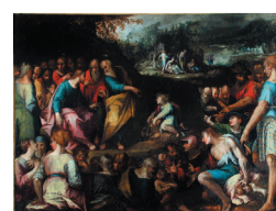
Attribué à Gaspare Bazzano La Multiplication des pains, vers 1600/05 Huile sur toile IP 467

On remarque alors que les corps se tordent dans des positions peu confortables , les figures s'allongent et se crispent dans des formes souvent serpentines. Les couleurs se font plus acides avec des gammes de jaunes, roses, vert citron... La peinture n'est plus vraiment basée sur l'étude du réel mais sur l' expression .