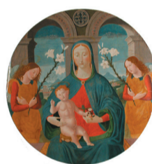
Maestro Esiquo La Vierge et l'Enfant Jésus entourés de deux anges Dernier quart du XV ème siècle Tempera sur bois IP 402

Retable : ensemble décoratif situé derrière l'autel d'une église constitué de peintures, sculptures, éléments architecturaux. Il peut prendre la forme d'un panneau simple (retable) ou de deux (diptyque) ou plusieurs volets articulés (polyptique), ouverts ou fermés selon les fêtes religieuses.