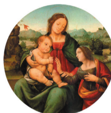
Atelier de Lorenzo di Credi, La Mariage mystique de Sainte Catherine d'Alexandrie Première moitié du XVI ème siècle Huile sur bois IP 256

La créativité s'est traduite par une production intense de toiles à sujets religieux, des retables et polyptiques servant à exalter la foi. Le musée en possède plusieurs exemples sous la forme de tondo ( tableau rond ) illustrant cette période de transition.