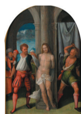
Benvenuto Tisi, dit Il Garofalo La Flagellation du Christ, vers 1527 Huile sur bois IP 474

L'architecte Filippo Brunelleschi (1377-1446) fonda les principes de la perspective scientifique , codifiés ensuite par l'architecte et humaniste Leon Battista Alberti (1404-1472) dans son traité De Pictura (1435). Ces idées sont très vite assimilées par des artistes comme le grand Masaccio (1401-1428) qui décora la chapelle Brancacci (Carmine) et révolutionna ainsi l'art pictural en provoquant un choc culturel. Si l'on observe attentivement les œuvres de cette époque, on remarque la présence de plus en plus systématique de paysage s'étalant en profondeur , des éléments d'architecture : des portiques, des édifices entiers. Au fur et à mesure, la représentation du corps, de l'espace, des paysages devient plus convaincante . Cette voie s'annonce dans l'œuvre de Botticelli, Filippo Lippi, Luca Signorelli dont certains des artistes exposés ici sont