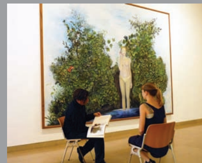
M. Rayssac, la Source © ADA&P Paris, 2010.