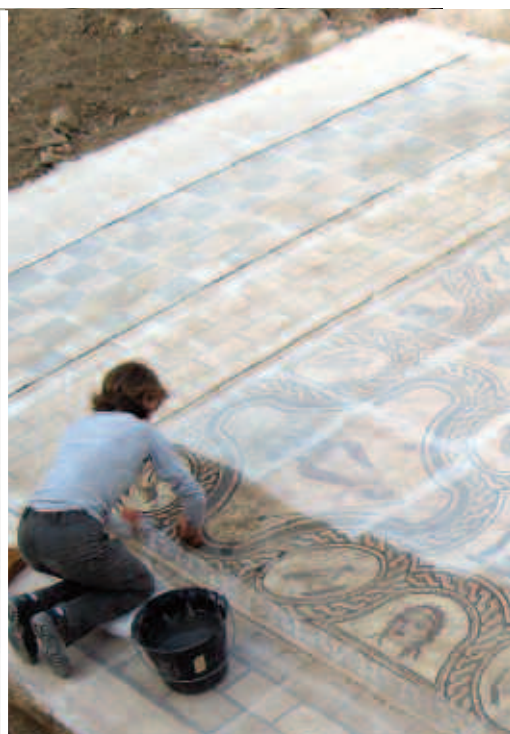
La mosaïque préparée pour être enlevée du sol

Les deux mosaïques romaines découvertes sur le boulevard Jean-Jaurès en 2007 ont été restaurées. Venues enrichir les collections du musée archéologique elles sont exposées ensemble pour la première fois à la chapelle des Jésuites jusqu'au 28 février 2010.