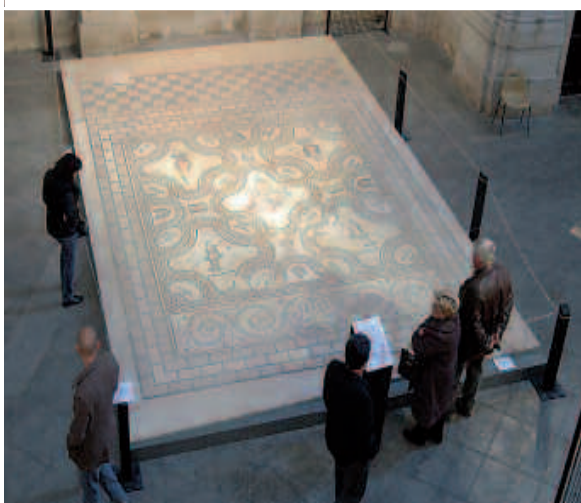
La mosaïque de Penthée

petits cubes de pierre, pour qu'elles ne se désolidarisent pas.