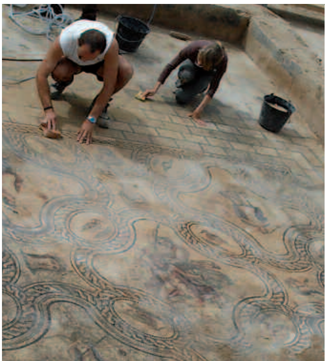
La mosaïque de Penthée découverte sur le boulevard Jean-Jaurès en été 2007