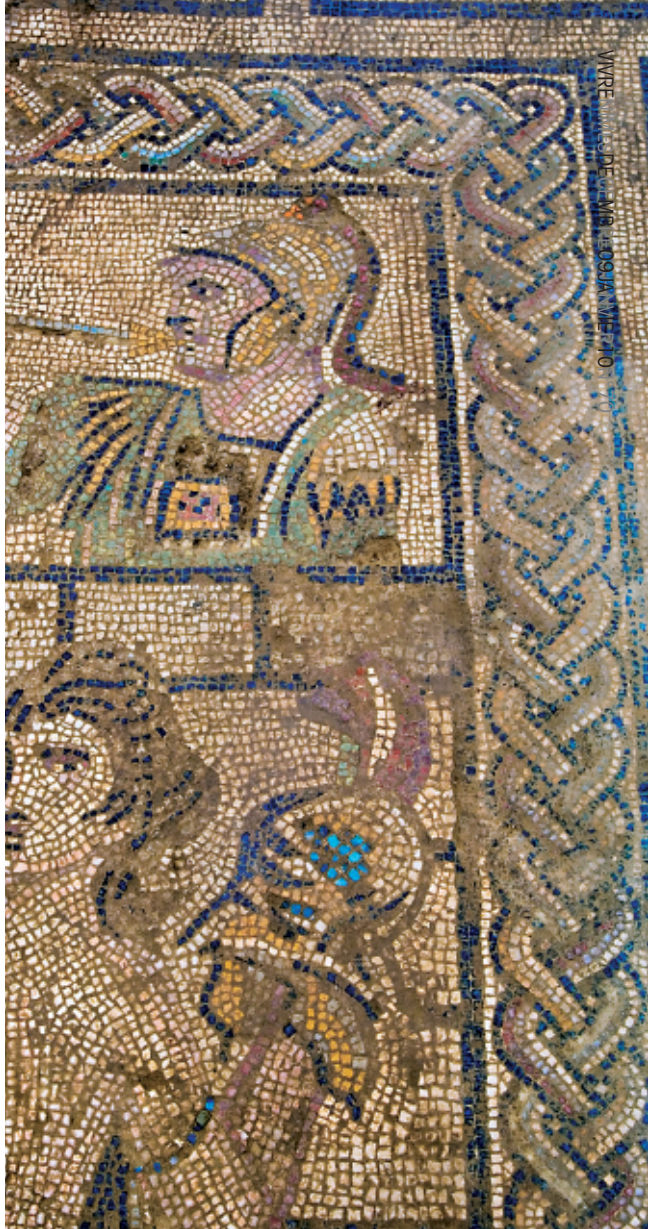
Détail de la mosaïque d'Achille