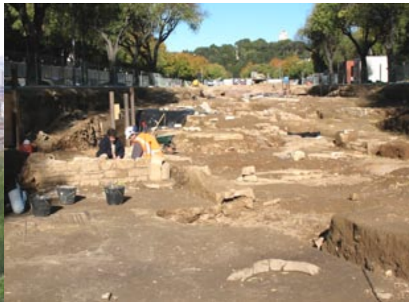
Vue générale du chantier, novembre 2006

La fouille archéologique visera à documenter plusieurs thèmes de recherche. Il s'agira de restituer la topographie initiale du site et de comprendre les conditions d'installation des occupations anciennes, en particulier de confirmer l'existence de cultures antérieures à la période romaine. Elle permettra également de comprendre la physionomie du quartier extra muros à l'époque républicaine (premiers noyaux d'habitat, part réservée aux cultures, rues) et les principales étapes de l'urbanisation du secteur à partir de la période augustéenne jusqu'à son abandon dès la fin du II e siècle. En définitive, il conviendra de percevoir le passage progressif d'une ville gauloise vers une ville en évolution permanente au contact de nouveaux usages, en caractérisant au mieux le ou les processus de romanisation.