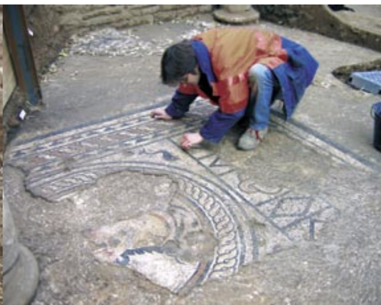
Bâtiment antique avec divinité masculine au pied d'une niche en forme d'abside