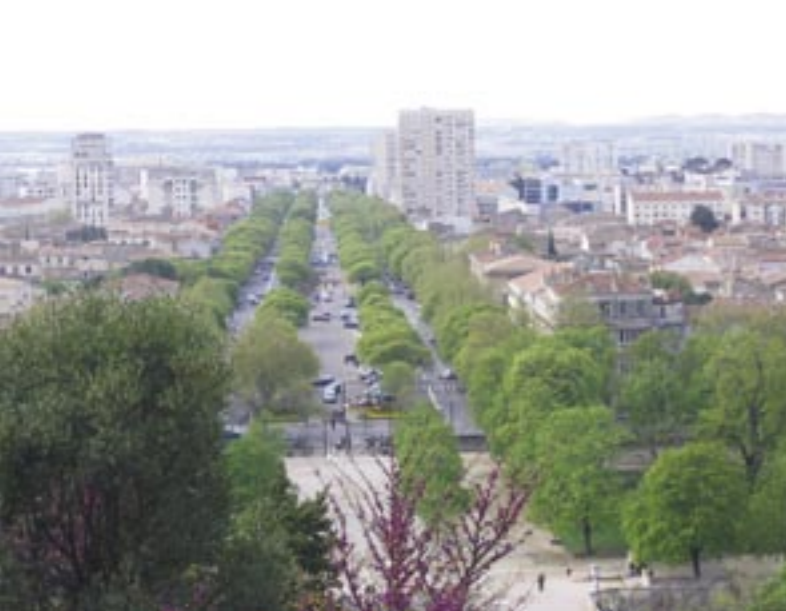
L'avenue Jean Jaurès depuis les Jardins de la Fontaine

Le diagnostic archéologique (évaluation du potentiel archéologique par le biais de tranchées) réalisé au printemps 2005 a confirmé la forte densité de vestiges. Au-dessus du terrain naturel, atteint 2 ou 3 mètres sous la surface actuelle, 1,50 mètre de couches antiques ont révélé un habitat à caractère résidentiel avec des sols construits, mosaïques et revêtements pariétaux, un quartier artisanal (fours de potiers), les différents îlots étant séparés par plusieurs rues dont certaines aménagées précocement, dès le I er siècle avant notre ère. Ces vestiges n'ont pas trop souffert des occupations postérieures ; ils demeurent relativement bien conservés, scellés par les terres de culture médiévales et les épais remblais modernes du Cours Neuf.