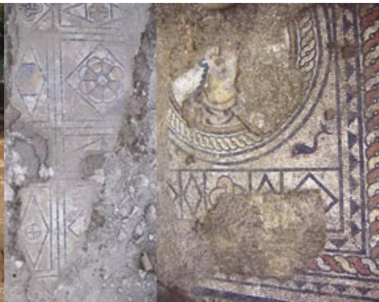
Mosaïques découvertes sur les fouilles de l'avenue Jean Jaurès

Inrap Méditerranée 12 rue Régale 30000 Nîmes tél. 04 66 36 04 07