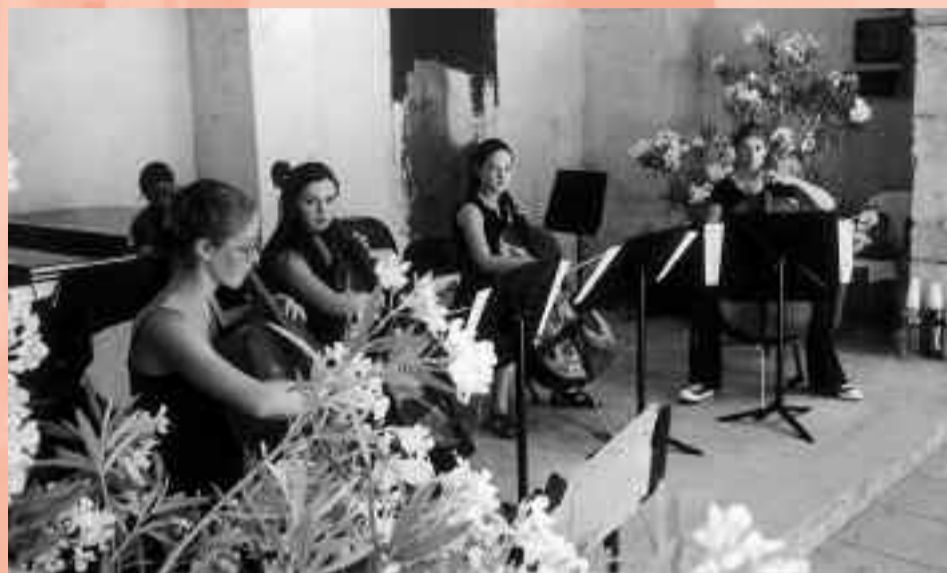
Ensemble de violoncelles à l'Annexe Pelloutier.