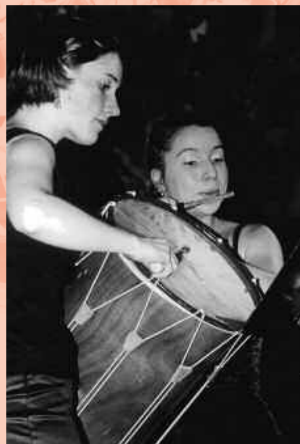
Piccolo et tambourin provençal au Musée des Beaux Arts.