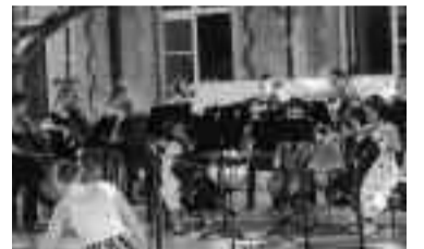
Orchestre à cordes de cycle 1

■ Nouveaux ateliers cordes du cycle 1 : dès les 2 e et 3 e années du premier cycle cordes (violin, alto, violoncelle), chaque élève aura à présent deux contacts hebdomadaires avec son professeur : un cours particulier, plus une pratique collective en petit groupe (4 à 10 élèves selon le professeur) sur une tranche horaire d'une demi-heure. Comme auparavant, l'élève parvenu en 4 e et dernière année du cycle 1 intégrera l'orchestre à cordes, conforté par ce premier palier de pratique collective.