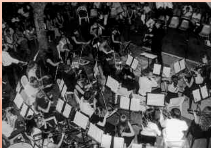
Orchestre Symphonique à l'Annexe Pelloutier.