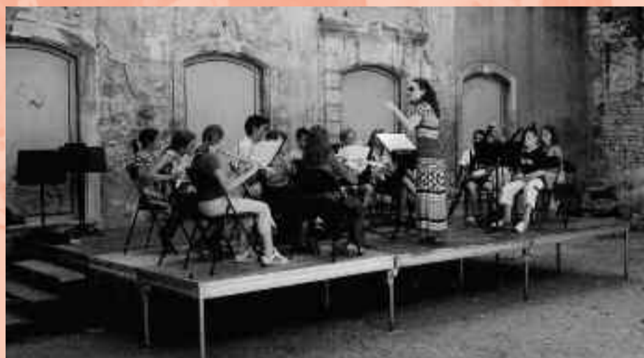
Ensemble des bois dans l'Hôtel de Bernis.