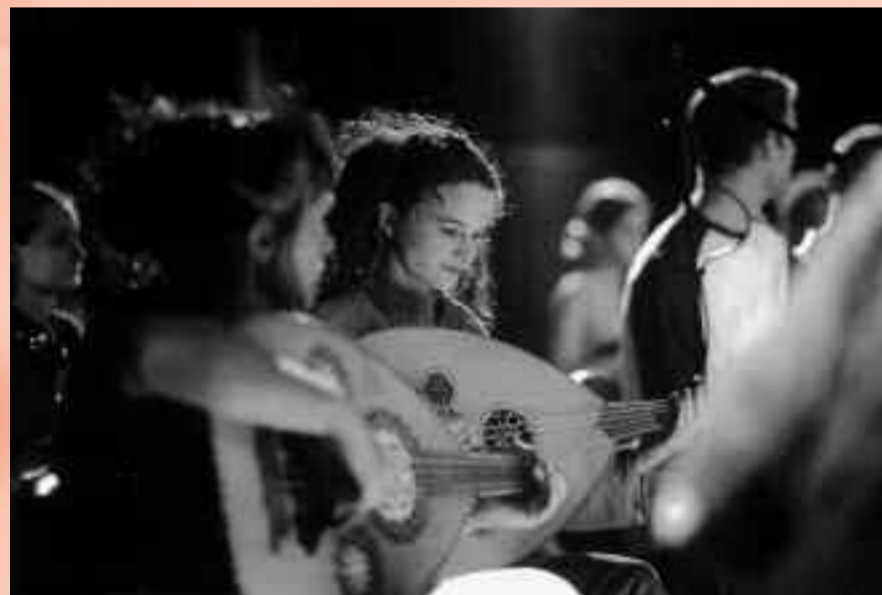
Classe de musique orientale - Cour de l'Evêché