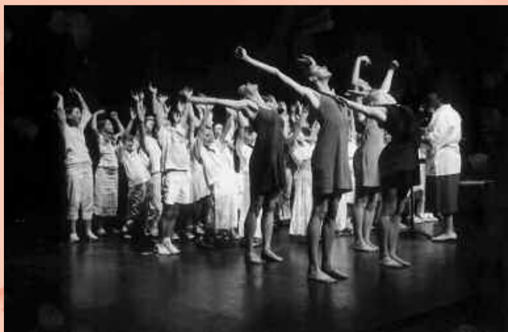
Spectacle de danse à l'Odéon.