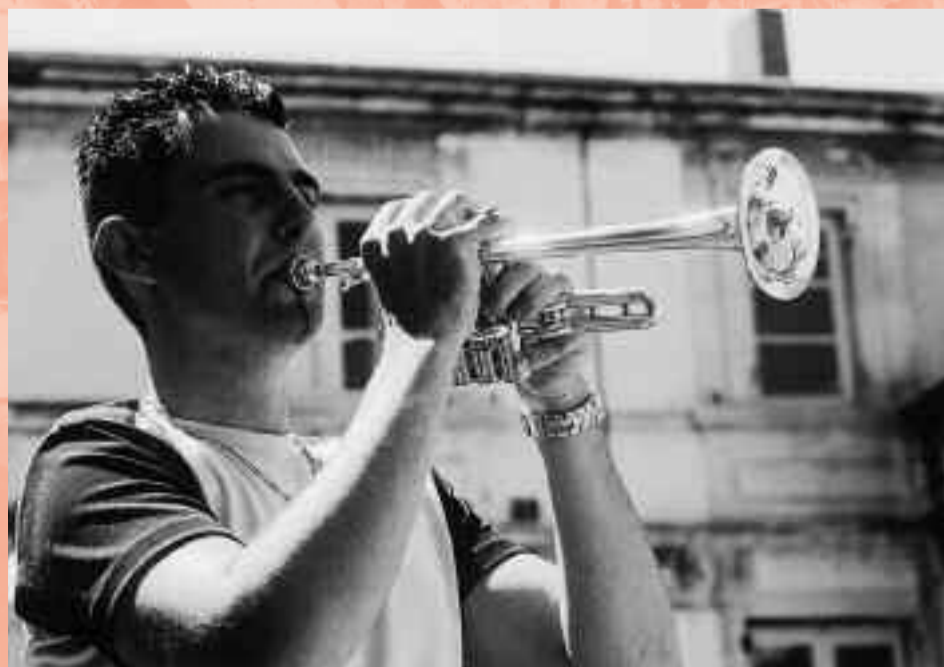
Le "héraut" dans la cour de la Prévôté.