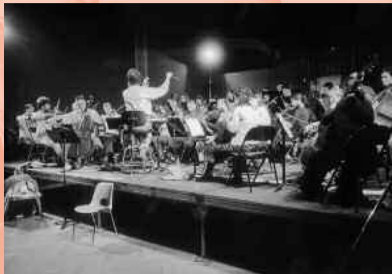
Orchestre Symphonique - Galerie Jules Salles.

Retour en photos sur la Fête de la Musique, cru juin 2003, où nos ensembles du Conservatoire se sont "éclatés" dans toute la ville.