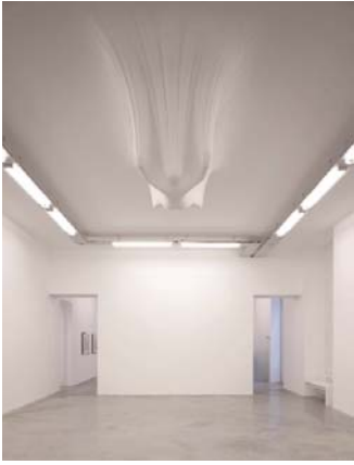
DANIEL ARSHAM Hammock, 2007