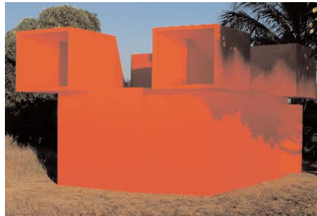
JEAN-PASCAL FLAVIEN Viewer Hard-Drive, 2007