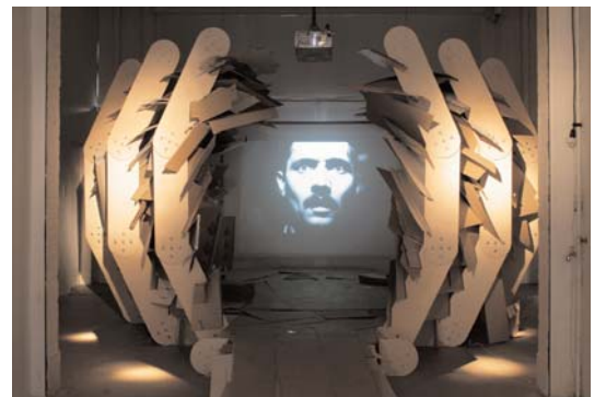
TOBIAS PUTRIH Argos Cinema, 2007