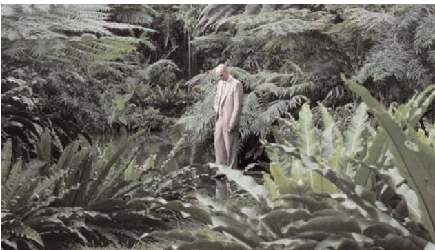
IÑIGO MANGLANO-OVALLE Oppenheimer, 2003