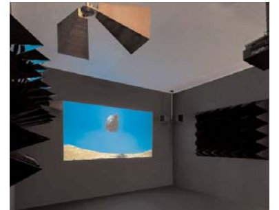
LAURENT GRASSO Psychokinesis, 2008