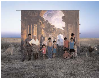
DANICA DAKIĆ La Grande Galerie, 2004