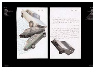
THE ATLAS GROUP/WALID RAAD The Fakhouri File, détail, 1996-2002