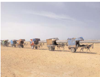
Wael SHAWKY Telematch Sadat, 2007