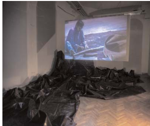
MAJA BAJEVIĆ L'Etui, 2005