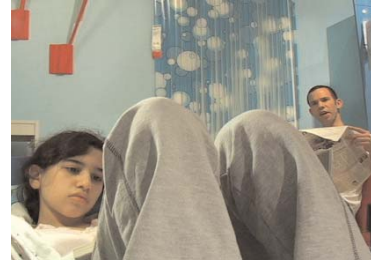
GUY BEN-NER Stealing Beauty, 2007