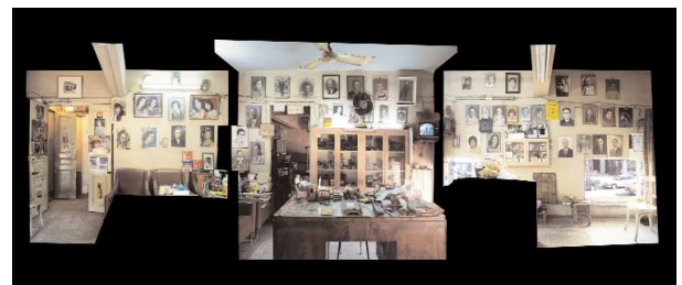
AKRAM ZAATARI Objects of Study / Studio Sheherazade/ Reception Space, 2006