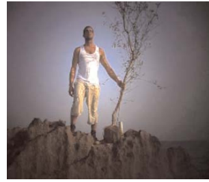
Yael BARTANA A Declaration, 2006