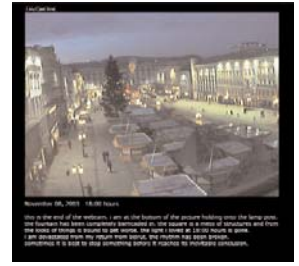
EMILY JACIR Linz Diary, 2003