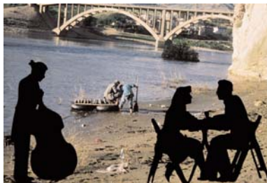
SENER ÖZMEN The Colonialist, 2006