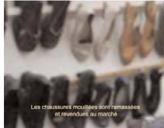
RHEIM ALKADHI Subtitles for Stolen Pictures, 2007