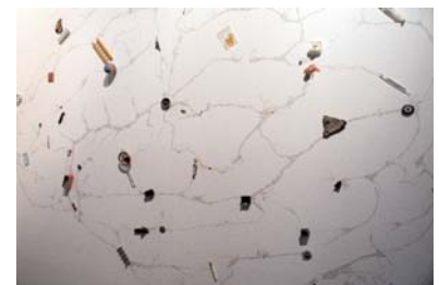
MÜRÜVET TÜRKYLMAZ Brain Map, 2007