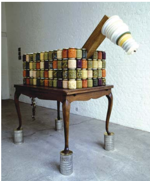
Le Cheval , 1985-1986 sculpture, 184 x 220 x 105 cm Collection particulière