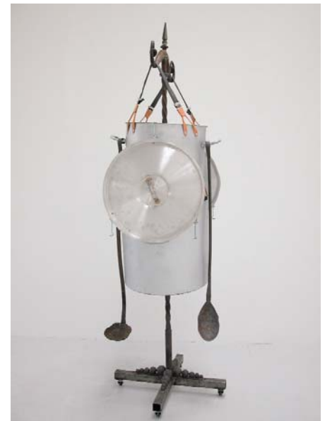
Mr Bondieu , 2001 sculpture, Ø 65 cm FRAC Bourgogne