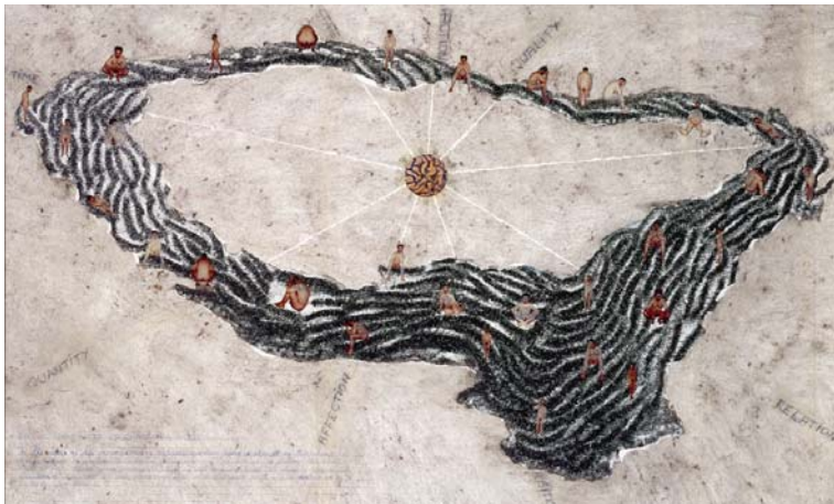
Projet pour Les Chenilles , 1991 collage, 100 x 164 cm Collection Daled, Bruxelles