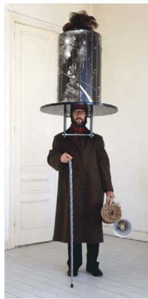
Chapeau ! , 1988-1989 sculpture, H 130 cm x Ø 80 cm Collection particulière