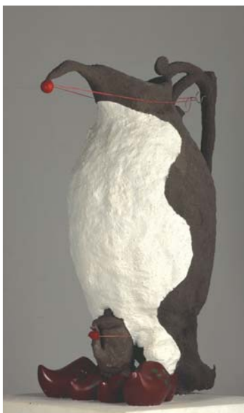
Tant Gusta , 1997 sculpture, 110 x 50 x 64 cm Coll. J. Le Roy & I. Koenders, Belgique