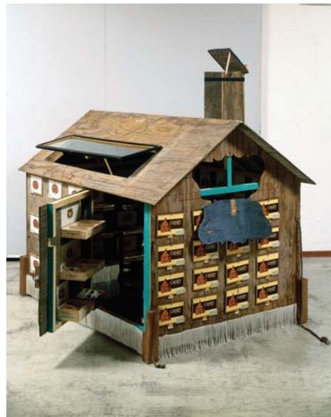
Clapier , 1999 sculpture, 177 x 131 x 177 cm Collection De Bruin-Heijn