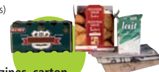
Papiers, journaux magazines, carton