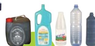
Plastique (bouteilles, sacs et films plastiques)