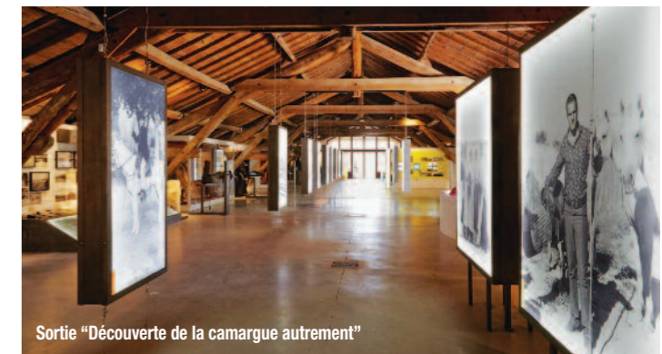
Sortie "Découverte de la camargue autrement"

VENREDI 19 OCTOBRE Sortie "Découverte de la camargue autrement" Départ vers les terres camargaises pour la visite du Musée du Riz.