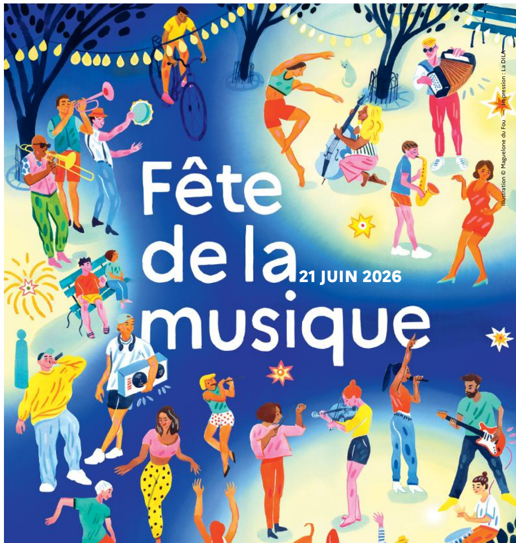
Illustration © Maguelone du Fou - Impression : La DILA